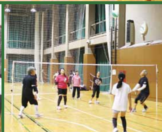
スポーツ、文化・芸術の秋