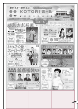
この枠に広告を掲載