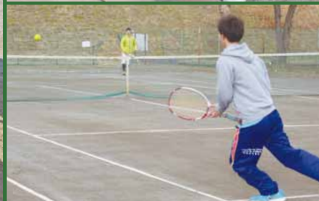
寒さに負けず元気いっぱい