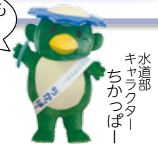
水道部 ちかっばー

「あきしまの水」の魅力を体感していただくため、市内事業者の協力による催しなどを行います。詳しくは、市ホームページにも掲載しています。