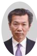
早川 修 副市長