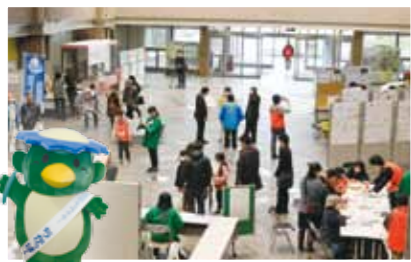
水道部キャラクターのちかっばーも登場しました!

3月19日(土)に市役所で開催され、「あきしまの水」ブランドのキャッチフレーズ「Thanks to you」やシンボルマークの発表のほか、「あきしまの水」を活かしたうどんやパンなどの配布、せっけんやストラップ作りなどの催しが行われました。