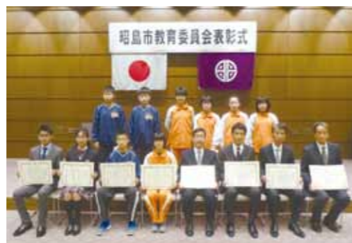
昭島市教育委員会表彰式