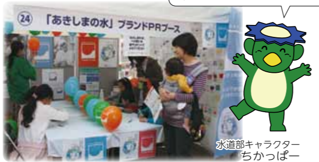
水道部キャラクター ちかっぱー