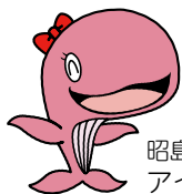
昭島市公式キャラクター アイルン

参加率(%)は… \frac{\text{運動した人の数}}{\text{市の人口}} \times 100 \text{ です}