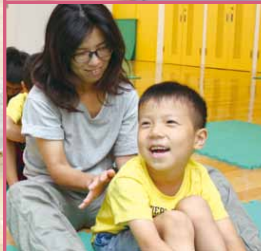
親子でふれあい、心も体もスッキリ