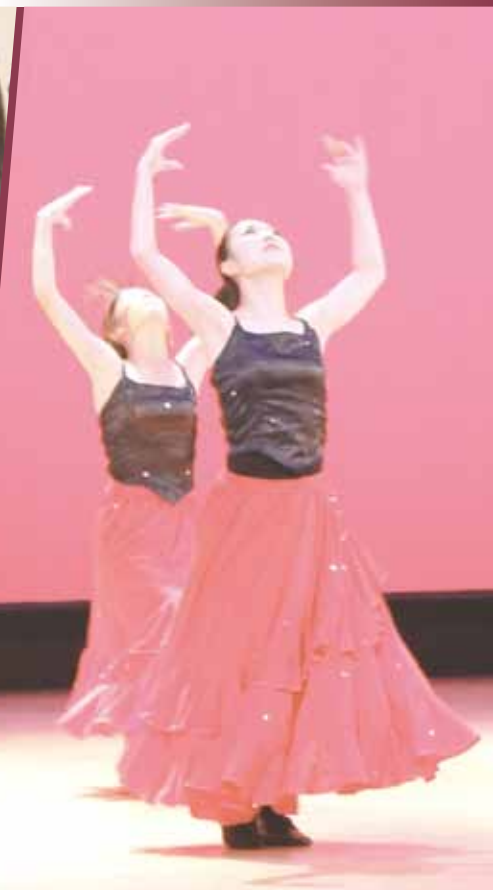
スポーツ、文化・芸術の秋