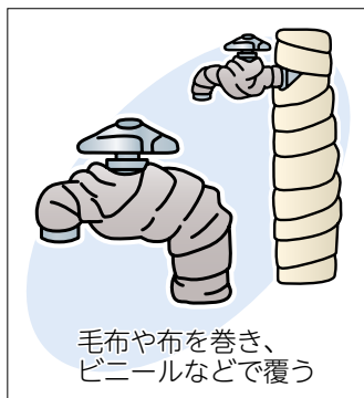
毛布や布を巻き、ビニールなどで覆う

◎ 早めに防寒対策を 気温が氷点下になると、屋外に露出している水道管や蛇口などの水が凍って破裂することがあります。 早めに次のような防寒対策をしておきましょう。 *毛布や布などを巻き、ぬれな