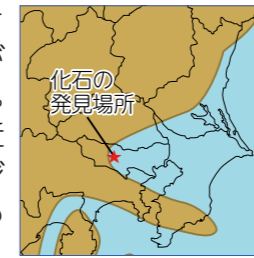
アキシマクジラが生きた時代の日本地図

アキシマクジラが生きた時代、昭島はクジラが悠々と泳ぐ海の中でした。なんらかの理由で海岸近くの浅瀬で息絶えたクジラは、それから200万年もの長い眠りにつきました。