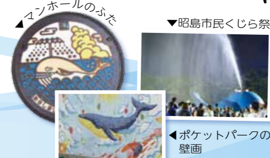
アキシマクジラのイメージ