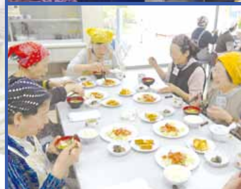
仲間と一緒に楽しく料理