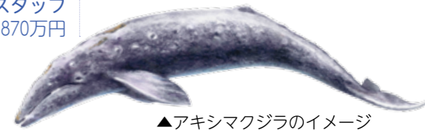
▲アキシマクジラのイメージ