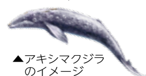
▲アキシマクジラのイメージ

化石は研究のため群馬県立自然史博物館で保管されていますが、その一部を4月22日～30日(土・日曜日、振替休日を含む)に市役所市民ロビーで展示します。あきしま環境緑花フェスティバルにお越しの際は、ぜひご覧ください。