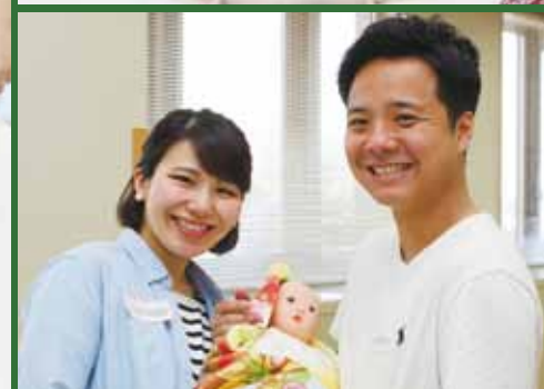
生まれてくる日を楽しみに