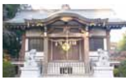
▲上川原・日枝神社

市役所市民ロビー「アケボノゾウ足跡化石(レプリカ)」、田中の庚申塔・馬頭尊・旧五日市鉄道武蔵田中駅跡(砂利線)〜田中・稻荷神社〜田中寺〜浄土古墳・観音寺〜大神・駒形神社〜ひざり地蔵〜おこり地蔵〜東勝庵〜旧五日市鉄道大神駅跡〜富士塚・惣十稲荷〜昭島駅(解散)