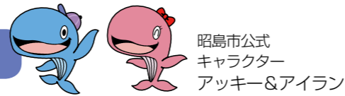
昭島市公式キャラクター アッキー&アイラン