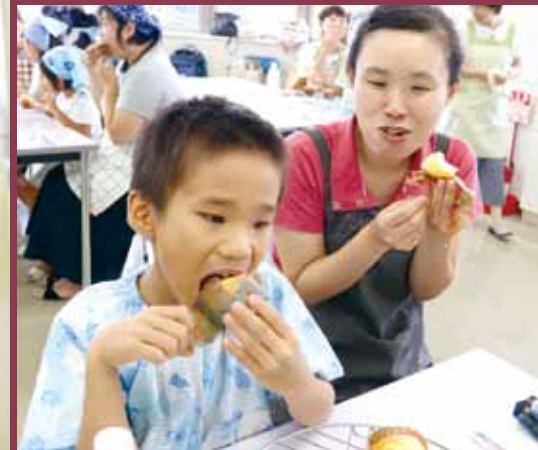
地元の食材で米粉マフィン作り