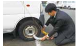
▲タイヤロックのようす