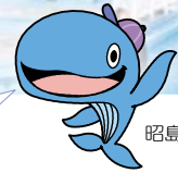
昭島市公式キャラクター アッキー