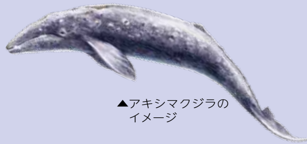
▲アキシマクジラの イメージ

教育福祉総合センターが令和2年3月(予定)に開館することを記念し、市民の皆さんや、昭島にゆかりのある方から写真を募集し、モザイクアート(※)を制作します。皆さんの笑顔や思い出がたくさん詰まった写真をご応募ください。