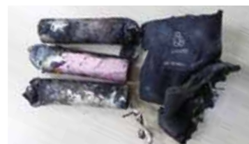
発火したリチウムイオン電池

☆詳しくは、リサイクル係(環境コミュニケーションセンター内) ☎ 546-5300へ。