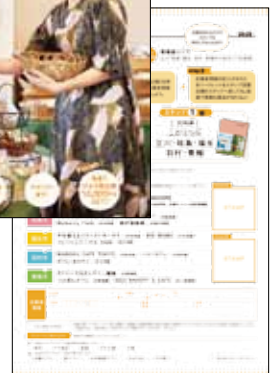
▲スタンプラリー台紙