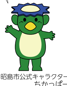
昭島市公式キャラクター ちかっばー

所得とは、収入から必要経費を差し引いた額です。サラリーマンなどの給与所得者は、必要経費の特定が難しいため、収入に応じて定められた必要経費を用いて所得を算定します。