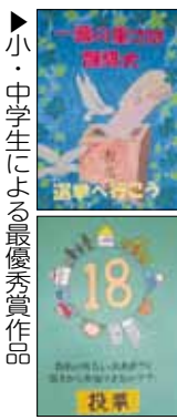
▶小・中学生による最優秀賞作品

●明るい選挙啓発ポスター入賞 作品を展示 日時2月18日(火)～21日(金)の午前8時30分～午後5時15分(21日は午後5時まで) 場所市役所市民ロビー 〈選挙管理委員会事務局〉