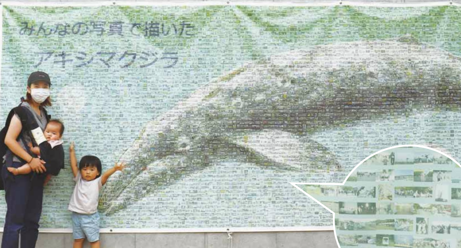
モザイクアート完成！