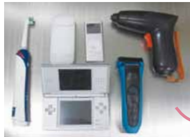
プラスチックや資源に混ぜると・・・

☆詳しくは、リサイクル係(環境コミュニケーションセンター内) ☎546-5300へ。