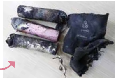
電池が発火するおそれがあります！