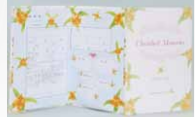
▲オリジナル婚姻届と専用ファイル