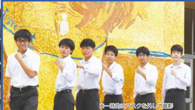
※一時的にマスクを外して撮影