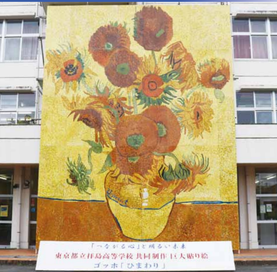
「心を繋ぐ」と明るい未来 東京都立拝島高等学校 共同制作 巨大貼り絵 ゴッホ「ひまわり」