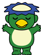
昭島市公式キャラクター「ちかっぱー」