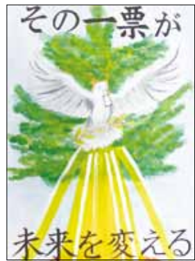
小学生の部 最優秀賞作品