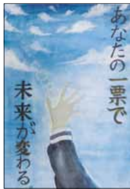
中学生の部 最優秀賞作品