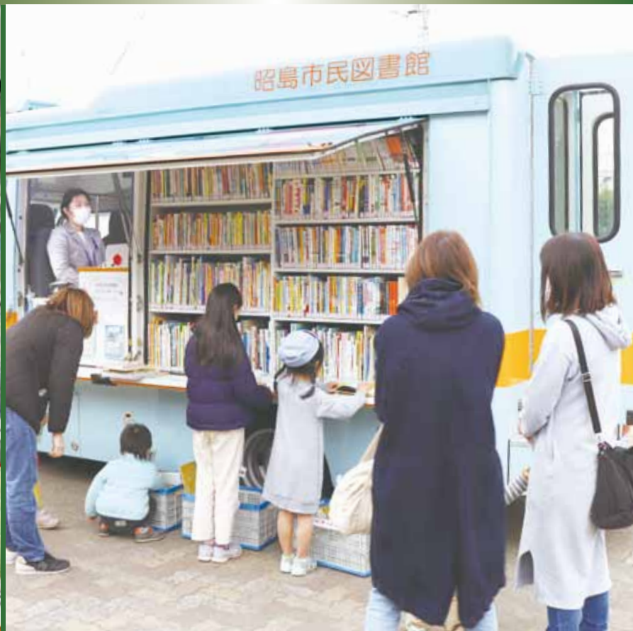
(移動図書館「もくせい号」／詳しくは6頁)