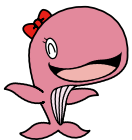
昭島市公式キャラクター アイラン

地域猫活動はボランティアで活動しています。お手伝いしていただける方を随時募集しています！