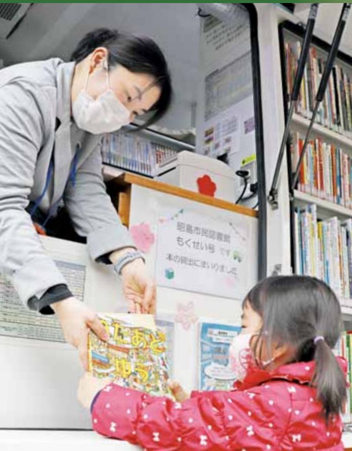
あなたと本を結びます