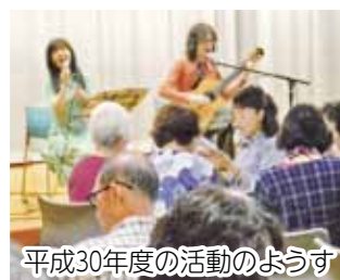
平成30年度の活動のようす

高齢化が進む中、地域で仲間と元気に楽しく生活するために、老人クラブに入会しませんか。 ☆詳しくは、高齢者支援係へ。