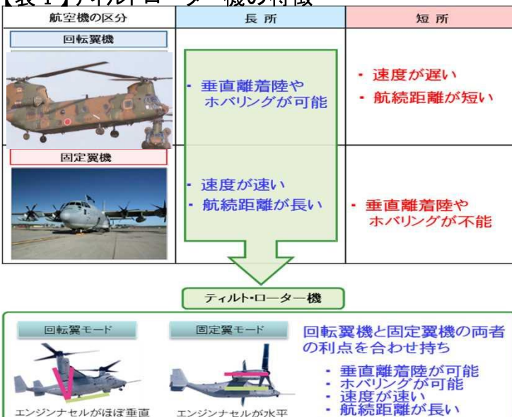
【表I】ティルトローター機の特徴

1,000 km離れた離島に約2時間で到着 (輸送ヘリコプターの場合は約4時間)