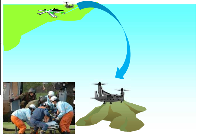
飛行場のない離島でも離着陸可能

1,000 km離れた離島に約2時間で到着 (輸送ヘリコプターの場合は約4時間)