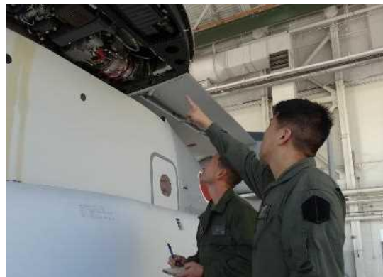
教育訓練による人材育成