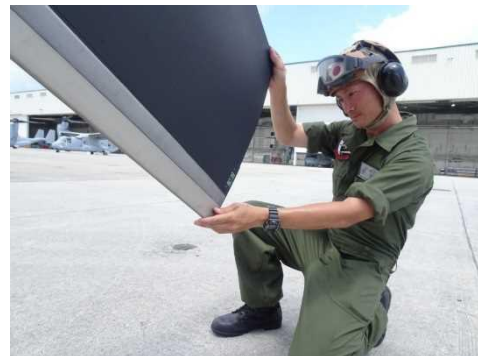
機体の到着、受入点検(令和2年7月上旬～)