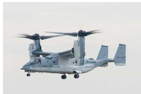
飛行開始(令和2年11月6日以降)