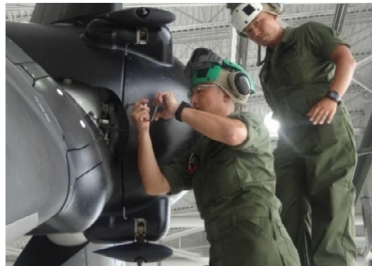
機体の点検・整備