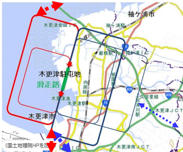
場周経路（イメージ）