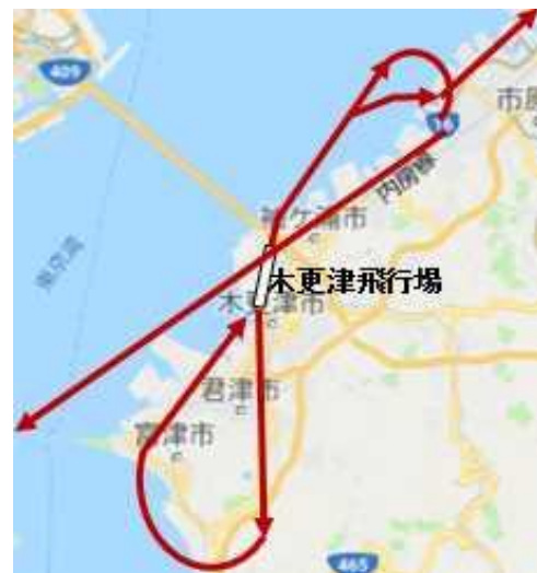
航空路誌に示す 離着陸経路（イメージ）