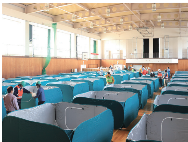
総合防災訓練の様子

突発的な首都直下地震の発生に備え、毎年実施しています。これは、市や市民、防災関係機関等が連携して、地震に対処するための総合的な訓練です。また、水害に対処するため周辺の自治体と連携して、出水期前に多摩川河川敷を会場に水防訓練を実施しています。