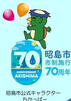
昭島市公式キャラクター ちかっばー