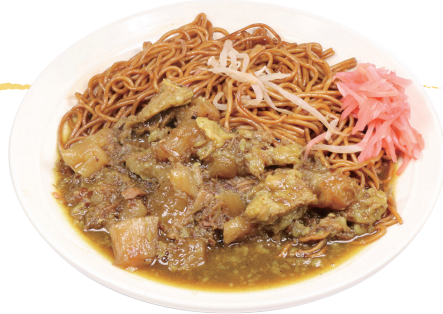
牛すじカレー焼そば

築地市場で店主が目利きした鮮魚をはじめ、ステーキ、PIZZA…をつまみ、メはラーメンで…常連さんでにぎわうチェーン店には決して真似できないThe個人店居酒屋です。