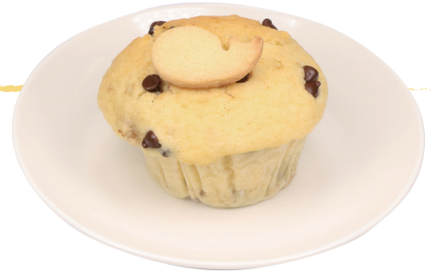
チョコバナナマフィン

中神駅北口から線路沿いを昭島駅方向へ歩いて3分。毎日10種類以上のマフィンを焼いています。果物やチョコレートたっぷりの甘いマフィン、カレーやミートソース等の甘くないマフィン、プレゼントにぴったりな焼菓子もそろっています。