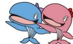
昭島市公式キャラクター アッキー&アイラン