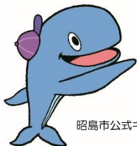
昭島市公式キャラクター アッキー

栄養価 (1人分) エネルギー200kcal たんぱく質 17.3g 脂質 7.0g 繊維 1.6g 塩分 1.3g