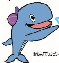
昭島市公式キャラクター アッキー

腸には独自の免疫システムがあり、免疫の要となる器官です。腸内環境を整える働きのある発酵食品は積極的に取り入れましょう！