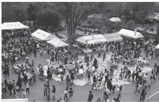
昨年の青少年フェスティバル