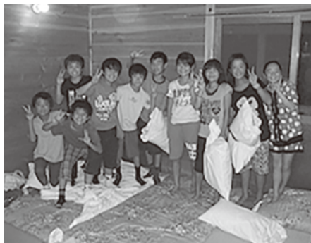
小学生リーダー講習会