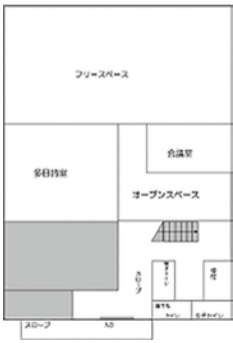
交流センター見取り図