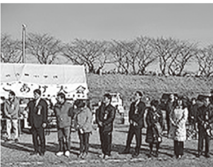
新春たこあげ大会