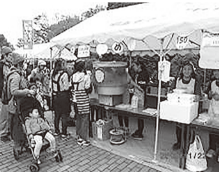
青少年フェスティバル模擬店