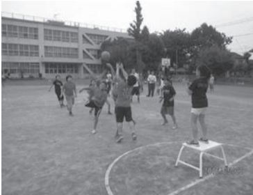
スポーツ大会 (玉川小地区)

市内には現在小学校が13校あり、各小学校区単位に「青少年とともにあゆむ小学校地区委員会（愛称：ウィズユース）」があります。ウィズユースは、未来を担う青少年の健全な育成を目指す地域の団体で、青少年の健全育成に関心のある方や、地域で青少年に関する団体が集まり活動する自主組織です。地区委員会に集まる方々の多様な知識、技能を活かして、地域の大人と子どもがふれあうことができる行事や、防犯パトロールなど、様々な活動が行われています。