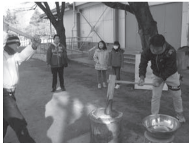
もちつき (共成小地区)

1月19日市役所市民ホールで開催した、子どもと親の家庭教育講座では、日常の子どもに対する言動によって子どもがどの様に感じ、育っていくのかわか