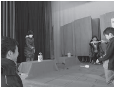
昔あそび (富士見丘小地区)