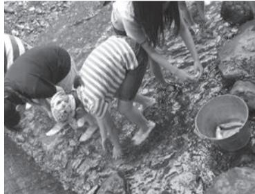
小学生リーダー講習会 (つつじが丘小地区)