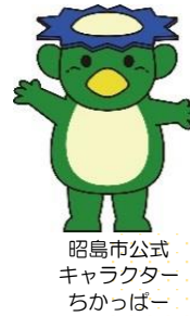
昭島市公式 キャラクター ちかっばー

「ことばが遅い」「こだわりが強い」「発達の偏りが気になる」 「落ち着きがない」「集団行動が苦手」「友達とうまく遊べない」 「幼稚園(保育所)、学校に行きたがらない」「いじめ」 「万引きやお金の持ち出しをする」「進路相談」など お子様の成長過程や、学校生活で生じる、さまざまな問題や悩みについて、ご相談をお受けしています。