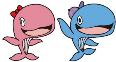
昭島市公式キャラクター アッキー&アイラン

*電話番号 042-519-2290 042-519-2247 *受付時間 月～金曜日 (祝日・年末年始を除く) 9:00～17:00