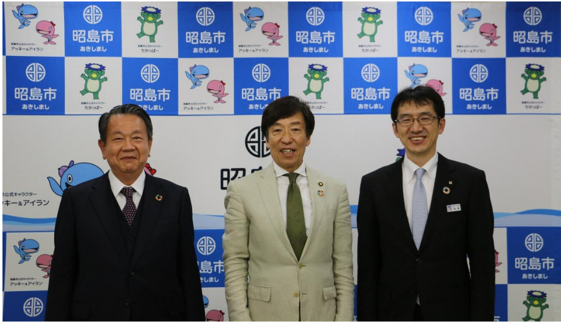
(左から、昭島ガス：平畑社長、昭島市：臼井市長、東京ガス：馬場事業部長)