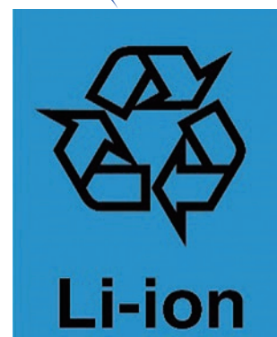
リチウムイオン電池のマーク