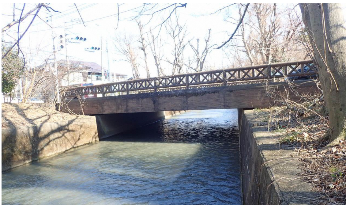
玉川上水に架かる美堀橋