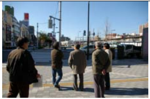
葛飾区・金町駅南口 5,400 m 2