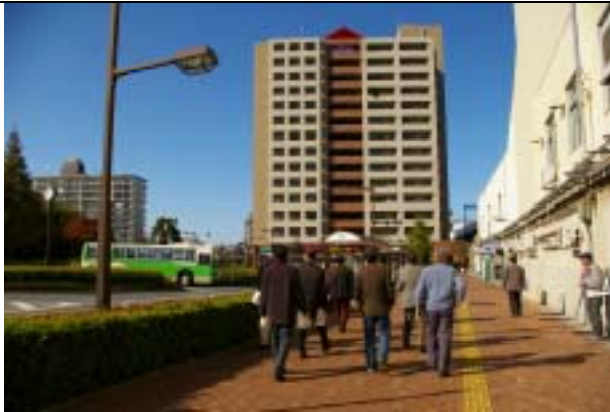
江東区・東大島駅大島口 5,640 m 2

今後もこのような見学会を行い、具体的な拝島駅南口駅前地区の将来の町のあるべき姿を検討する参考にしていきたいことが重要だと考えます。