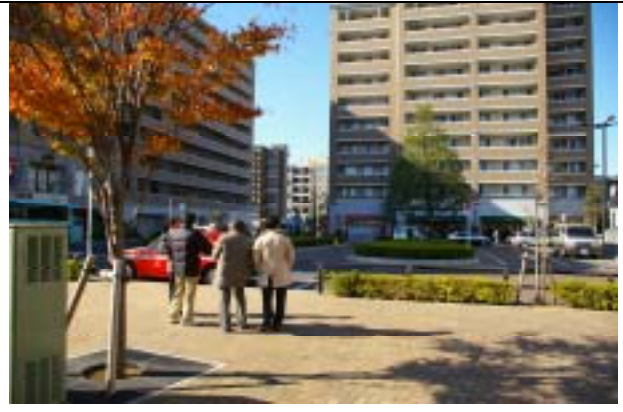
江戸川区・一之江駅環 7 口 3,600 m 2