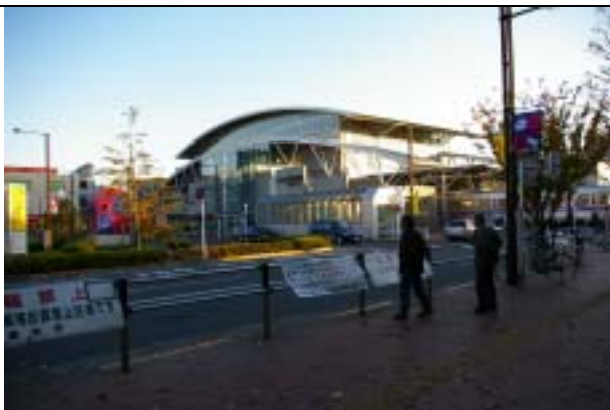
調布市・飛田給駅 4,600 m 2