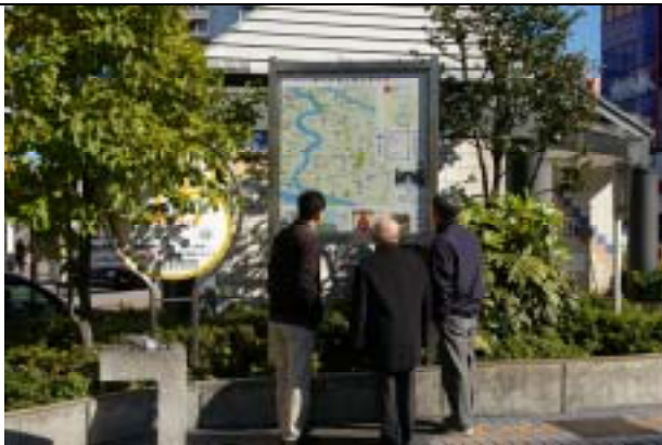
葛飾区・新小岩駅南口 5,590 m 2