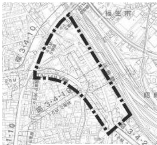
まちづくり検討対象範囲

★「まちづくりニュース」についてのお問い合わせ、揖島駅南口駅前地区のまちづくりに関するご意見等ございましたら、お気軽に右記までお寄せください。