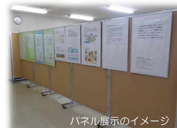
パネル展示のイメージ