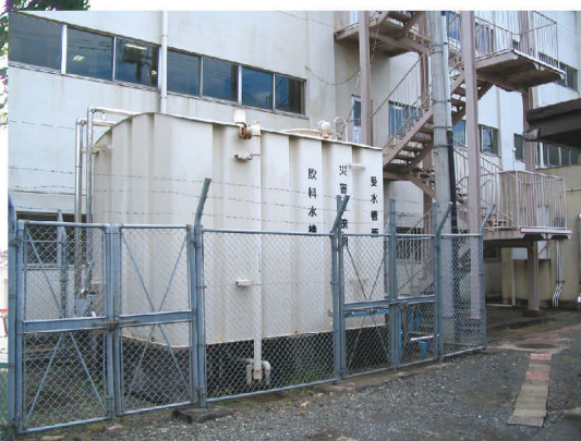
学校に設置されている飲料貯水槽