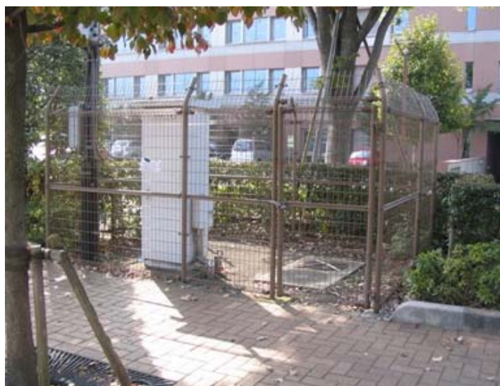
西部第5水源(市役所駐車場内)