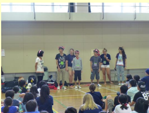
みんなの前で英語劇などを発表！緊張したけど頑張りました。