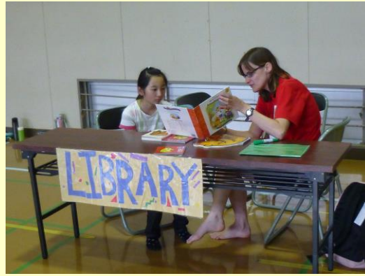
アメリカの街並み再現～ 図書館コーナーと医者コーナー