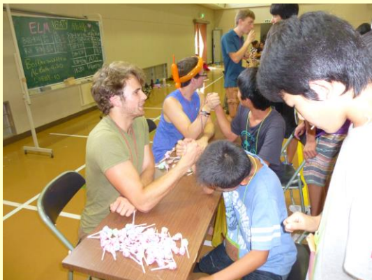
腕相撲で勝つとキャンディGET