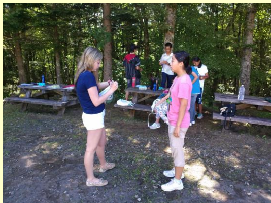
施設外での活動の様子