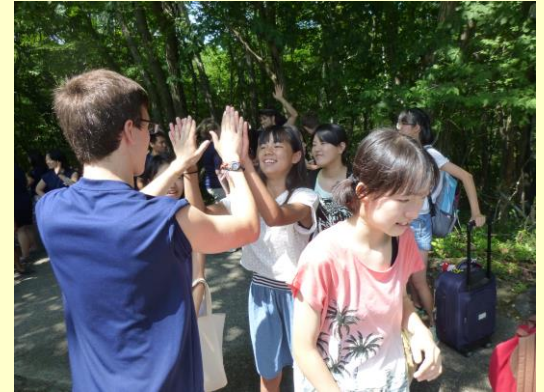
ハイタッチで「また会おうね！」