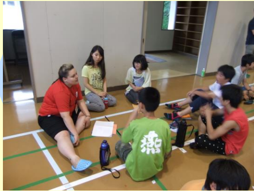
車座になってグループ活動