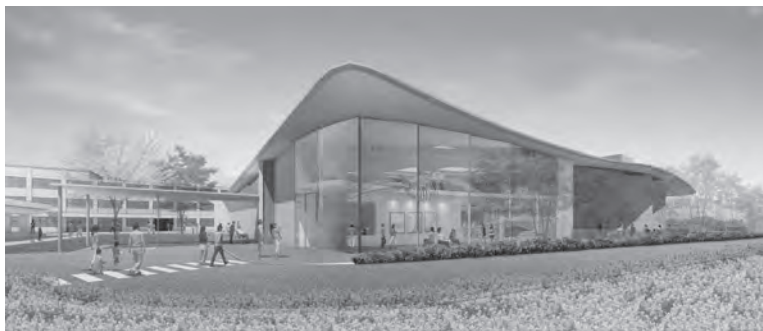
新築棟外観図 (イメージ)