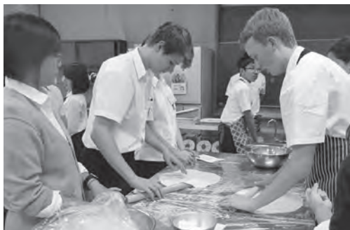
うどん作り体験の様子

昭島市では、今後も中学生海外交流事業を継続して行い、「国際的視野に立つて活躍する人材の育成」を図ってまいります。