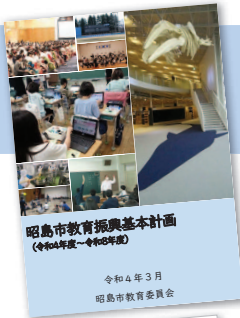
昭島市教育振興基本計画 (令和4年度～令和8年度)

本市の基本計画である「総合基本計画」が掲げる「未来を担う子どもたちが育つまち」 「文化芸術、スポーツの振興を図るまち」の実現に向けて、4つの計画を策定しました。