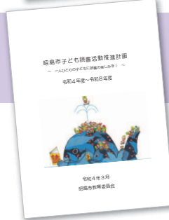
昭島市子ども読書活動推進計画 (令和4年度～令和8年度)