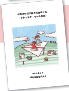
昭島市特別支援教育推進計画 (令和4年度～令和6年度)