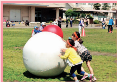
スポーツ大会開催