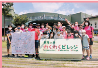
わくわくビレッジ訪問