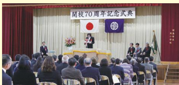
東小学校 開校70周年記念式典の様子